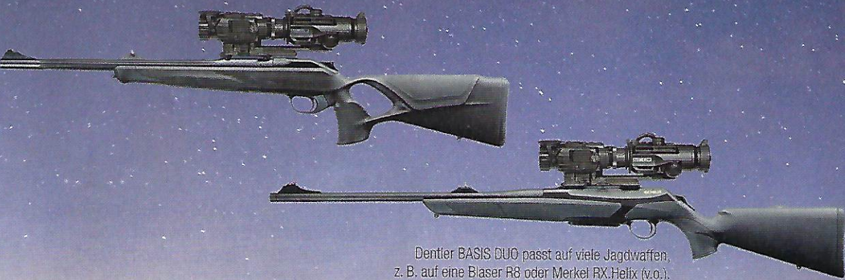
Dentler BASIS DUO passt auf viele Jagdwaffen, z. B. auf eine Blaser R8 oder Merkel RX Helix (v.o.).

Darum hat Dentler für sein modulares Zielfernrohrmontagesystem BASIS & BASIS VARIO eine spezielle Montageschiene BASIS DUO entwickelt, die es ermöglicht, eine „Tages“-Optik und ein Vorsatzgerät miteinander zu kombinieren, ohne einen Klemmring mit dessen oftmals negativen Auswirkungen auf das Zielfernrohr oder die Wiederholgenauigkeit zu verwenden. Dabei wird die Optik fest auf der BASIS